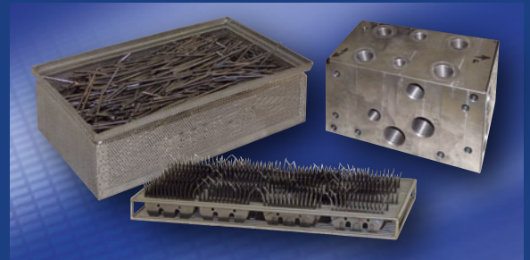
Gesteigerte Produktivität durch das Entmagnetisieren von vielen Teilen. Schüttgut, Transportbehälter mit Inhalt oder auch komplexe Einzelteile werden mit einem Puls entmagnetisiert.