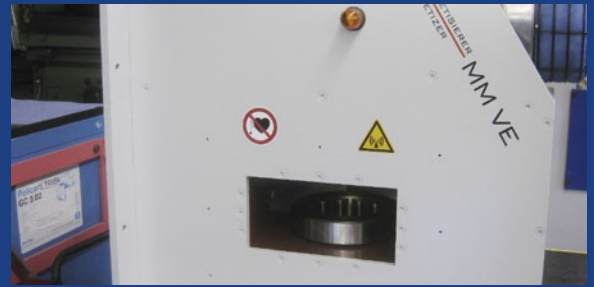
Vollständige Entmagnetisierung von montierten Wälzlagern mit Pulsstechnologie und hoher Feldstärke.