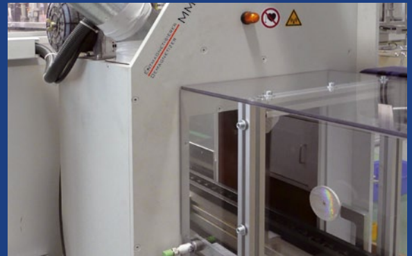
MM VE mit integrierter Lichtschranke zur Pulsauslösung. Die Anlage arbeitet dadurch völlig automatisch.